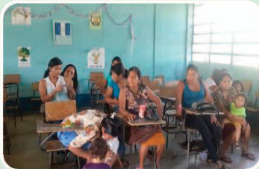
Reunión con Comites de Mujeres de las comunidades de Las Vegas y Suiche III