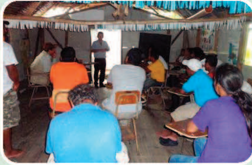
Reunión Con Líderes de la Graciosa