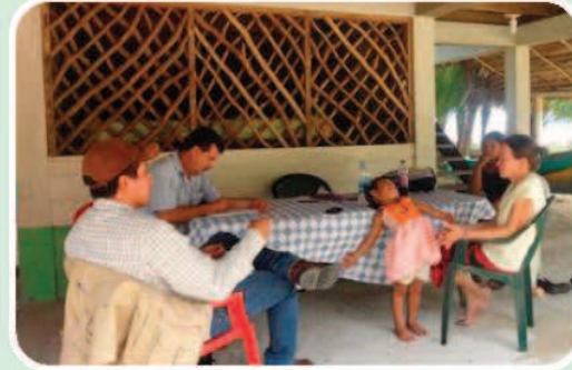
Reunión Con los líderes de Estero Lagarto