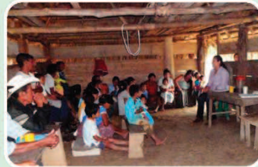
Asamblea en la comunidad del Ceibal