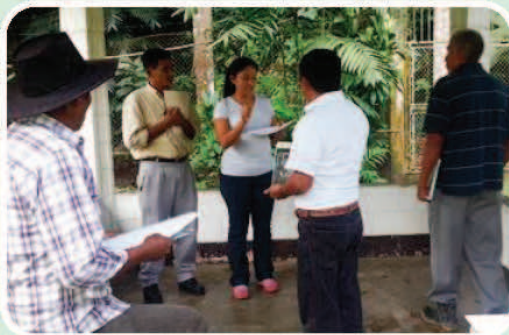
Taller de Presentación y validación del Diagnóstico