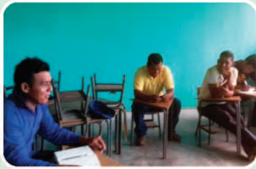
Reunión con líderes de la comunidad Quetzalito