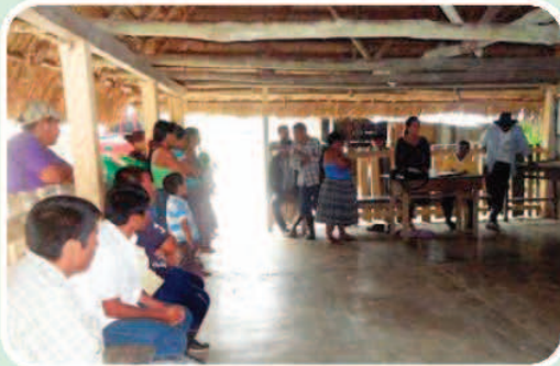
Reunión en la comunidad de Machaquitas Chiclero