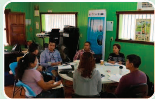
Reunión con equipo técnico de UTRVSPM